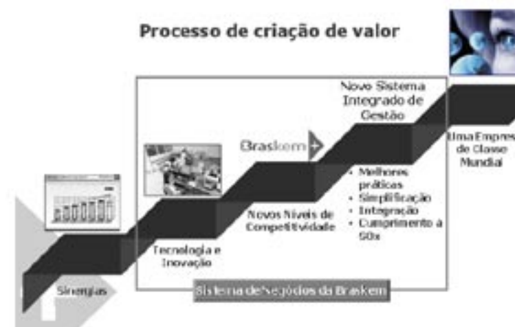
Figura 1. Sistema de Negócios da Braskem.